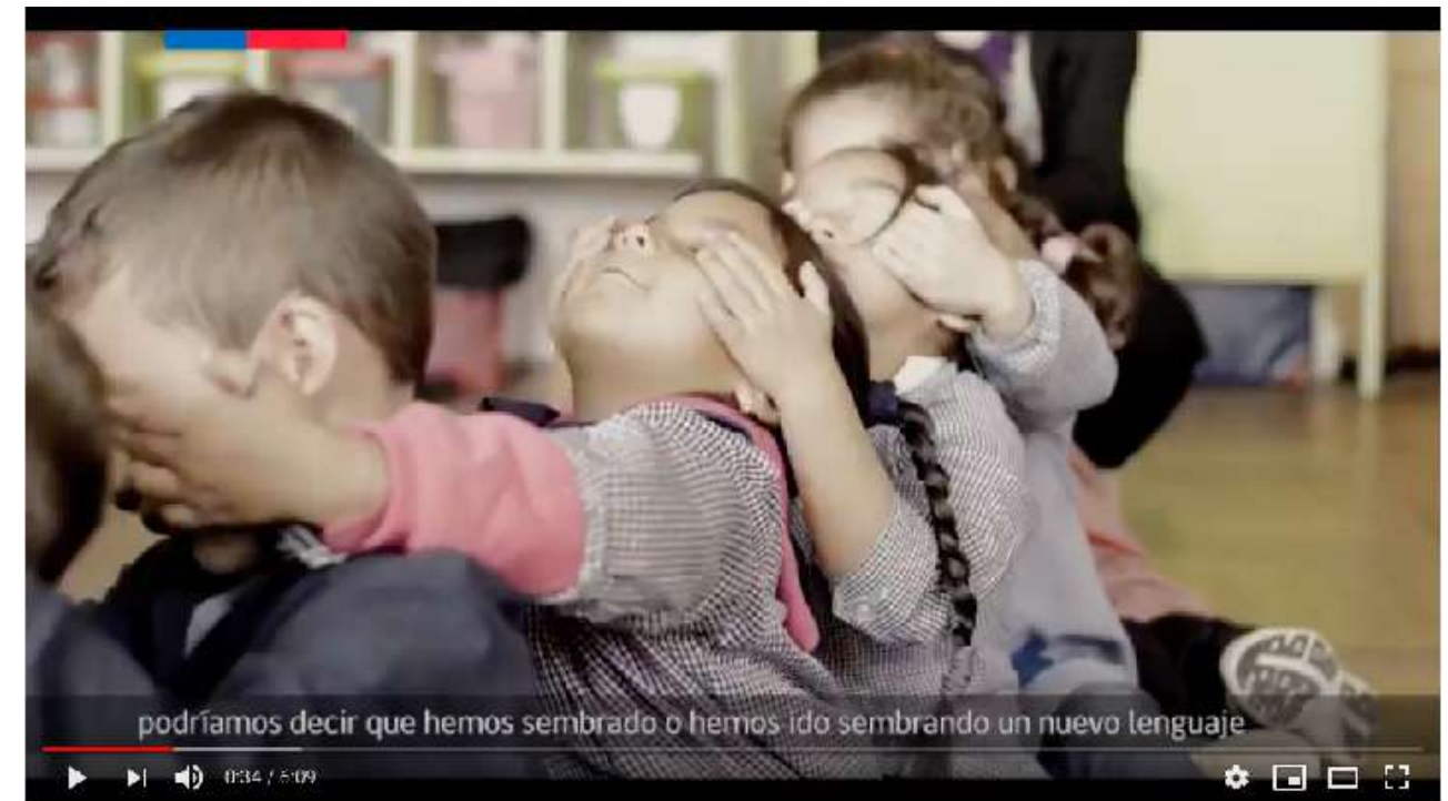
escenaborde en Escuela República de El Salvador en Cerro Cordillera

Video escenaborde en Escuela República de El Salvador https://www.youtube.com/watch?v=737kjrBpoql