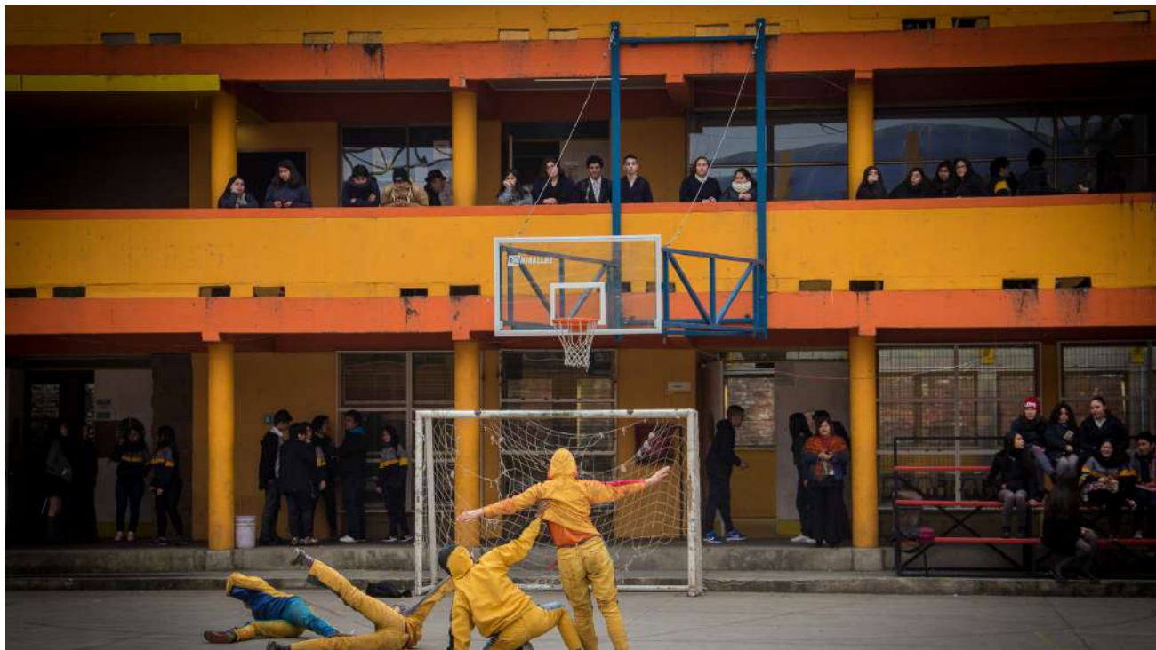
“Mide un segundo” en Instituto Superior de Comercio de Valparaíso.