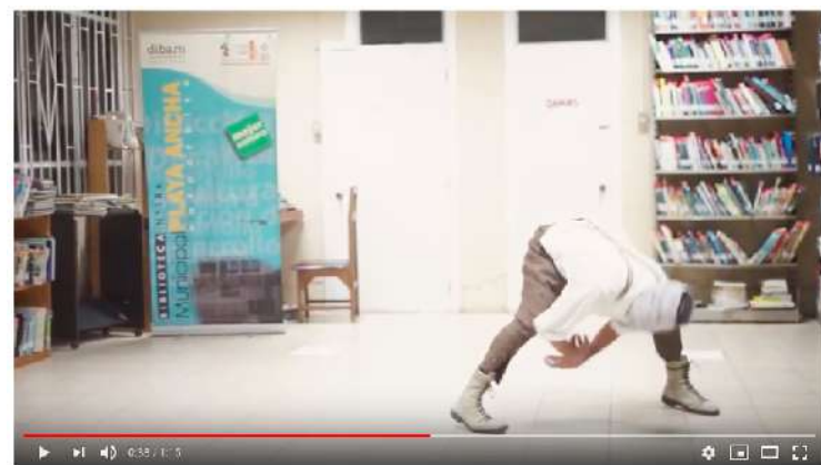
Video Danza en la Biblioteca 1 https://www.youtube.com/watch?v=68AefrAMV14&t=14s